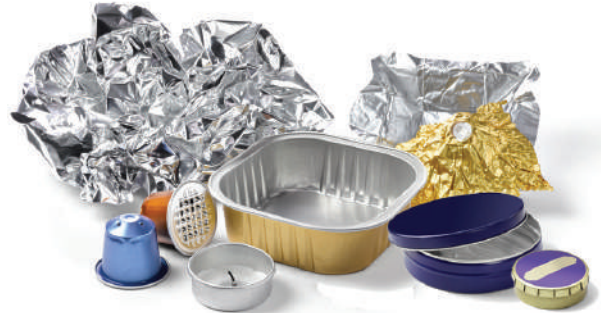
Capsules café, Bougies chauffe-plat, Barquettes, Boîtes et Feuilles