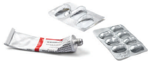
Tubes de crème Plaquettes et blisters de médicaments

Si votre jour de collecte « tombe » un jour férié : la collecte est systématiquement reportée ou avancée au mercredi de la même semaine.