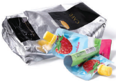
Sachets café Poches de compote