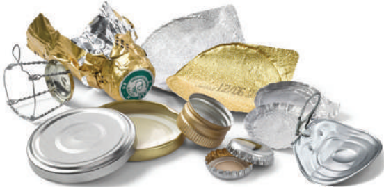
Bouchons, Capsules, Couvreuses, Opercules, Collerettes et Couronnes

Dorénavant, tous les «petits aluminium» se trient et se recyclent. Ils sont à déposer en vrac dans les contenants de tri.