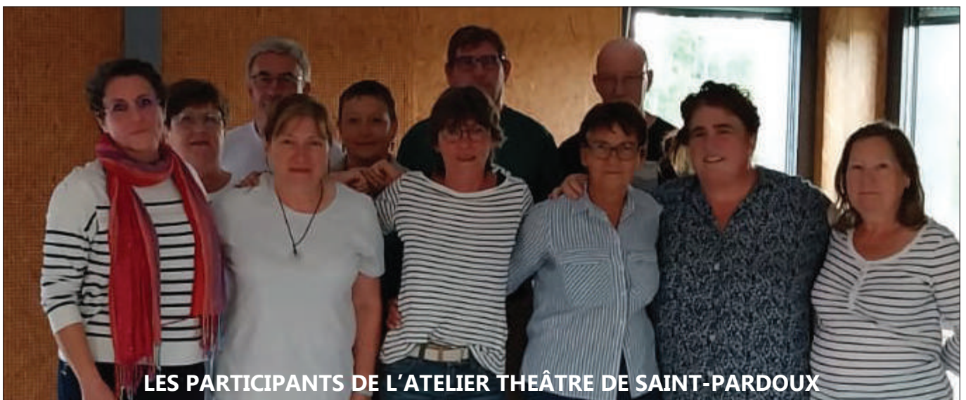
LES PARTICIPANTS DE L'ATELIER THÉÂTRE DE SAINT-PARDOUX